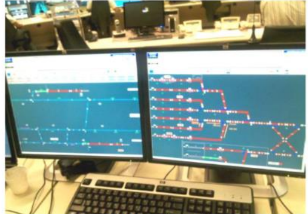
Painel de controle de tráfego