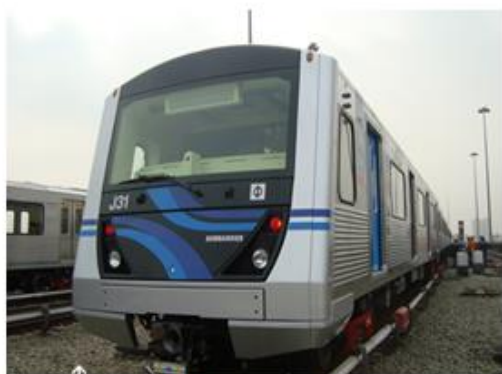
Linha 1 - Azul