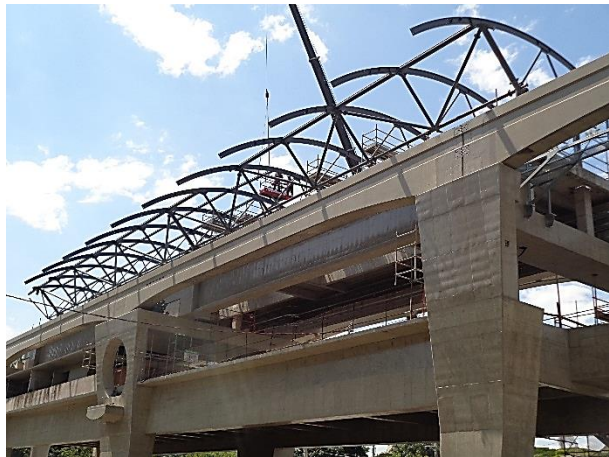
Corpo da estação – Montagem da cobertura metálica.