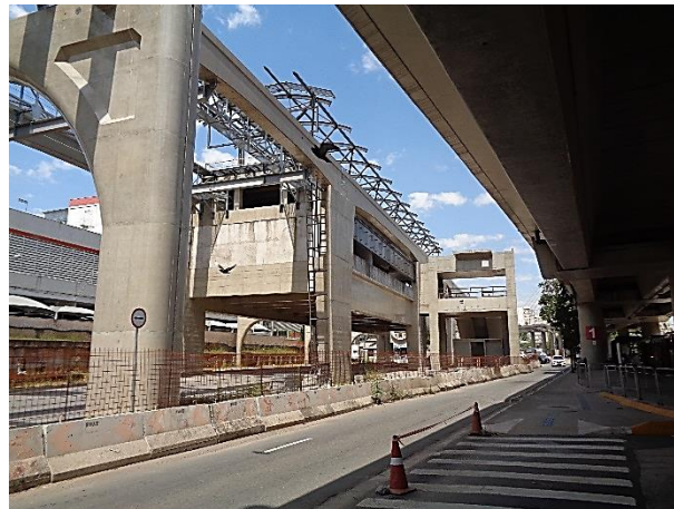
Corpo da estação – Vista Geral.