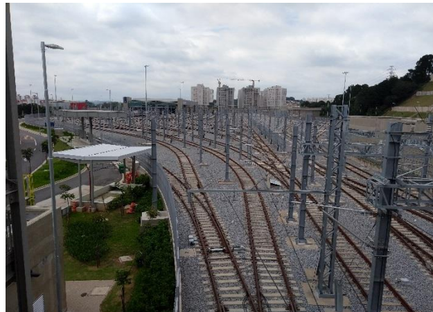
Vista das vias do Pátio