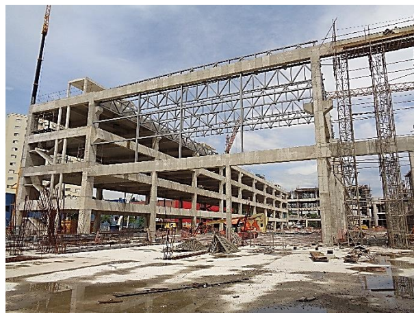
Em execução os pilares do Bloco A e estruturas metálicas.