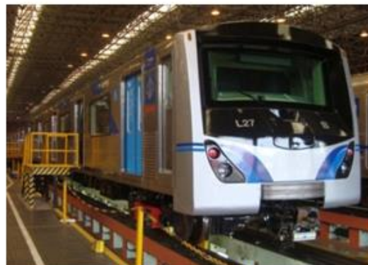
Linha 3 - Vermelha