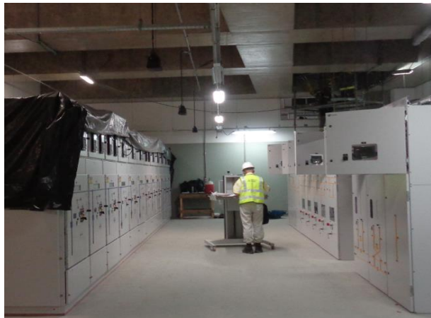
Salas técnicas: Vista das Sala Técnicas