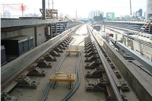
Equipamentos na via