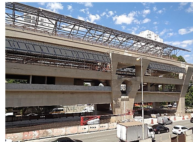
Corpo da estação.