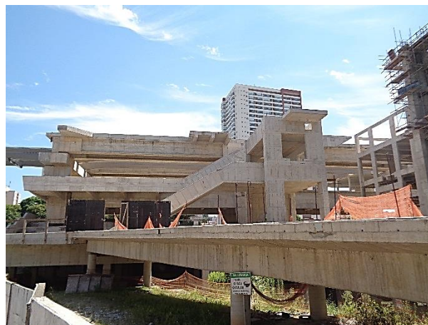
Corpo da estação