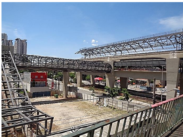
Vista da cobertura metálica do acesso e das passarelas metálicas.