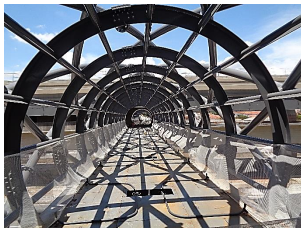
Passarela metálica entre estação e acesso.