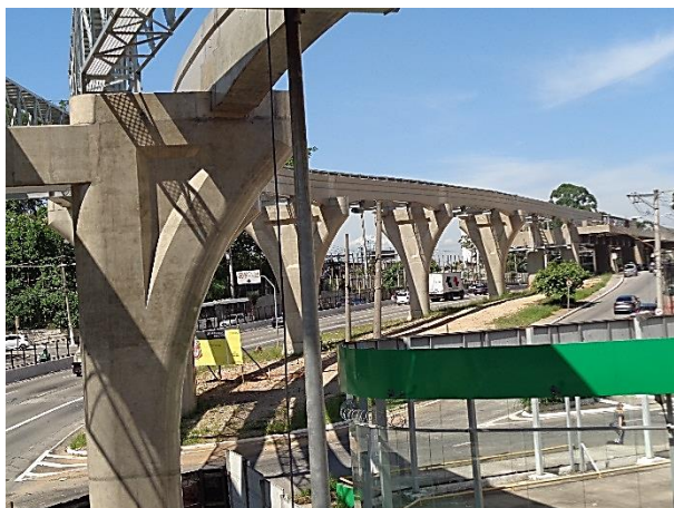
Vista das vias do monotrilho